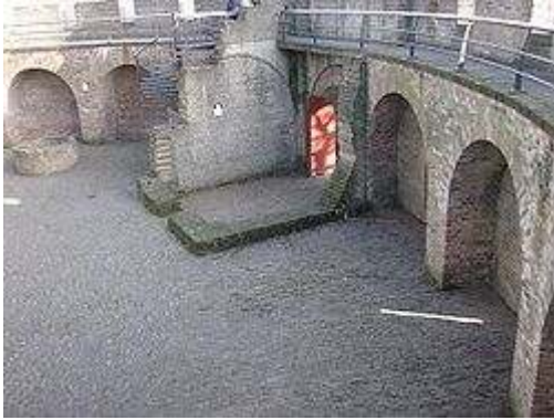
weergang – (Leiden)- Wikipedia

De walmuren waren op de hoeken voorzien van torens, waar vanuit het voorfront, de toegang tot het kasteel en de binnenplaats bewaakt konden worden.